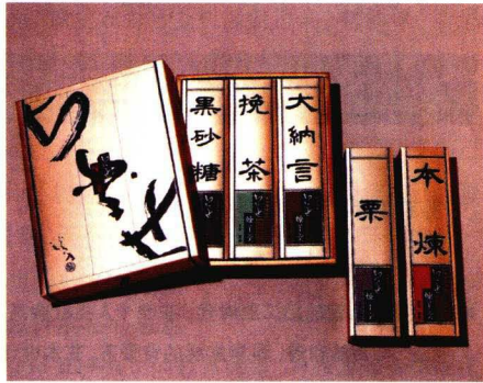
图5 秋月繁包装作品

面”。锥面与木材的结合，本身就是天然的符契。民间的锥面具图案本身就是描绘在木制材料上的。他在设计民间包装包装时，最大限度的保留原生态的木纹，给人以自然的亲切感。（图4）