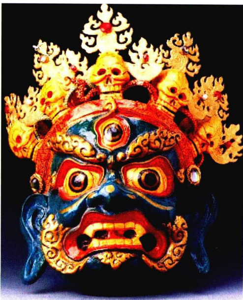
图2 中国民间傩戏面具

数码时代的包装设计,过多的展现出当下产品丰富背景下的浮华风格。从白酒包装、食品包装(如月饼)、茶叶包装等,在中国传统元素的“覆盖”下,充斥着市场。遗憾的是,在这些很大部分的浮华礼品中,除了奢华,很难让人能从内心触动,并唤起记忆。对传统元素的滥用,是对传统元素缺乏深入理解的照本宣科。因此,对日本老一辈设计家秋月繁的设计解读,可以针对上面的提到的对传统元素的认识有启迪作用。