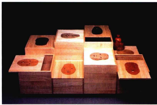
图4 秋月繁民间玩具包装