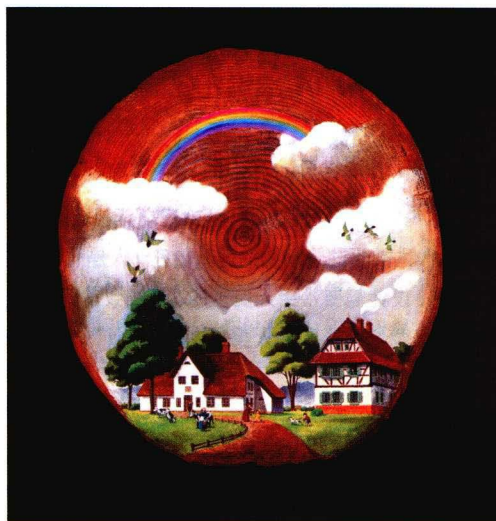
图6 秋月繁插图作品

总之，秋月繁的设计向我们展示了他理解的传统。他以“锥面”元素为设计核心，充分展示了他的设计理念。自然、乡土、传统、朴素以及温情的回忆都在他的作品中展示无遗。在浮华的设计风气下，无疑他的设计拉近了作品与人的距离。他曾经说到，他在战后访问中国的时候，中国地方产业的香烟设计，仅仅是在极普通的纸卷上，进行简单印刷的香烟，用插图把当地的名胜古迹或土特产画上，写上公司和产品名，充满浓郁的地方特色。这样的设计让人难以忘怀…… 包装世界